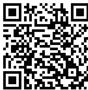
JKO 指定ヘッドギア用 飛沫防止シールド作成方法