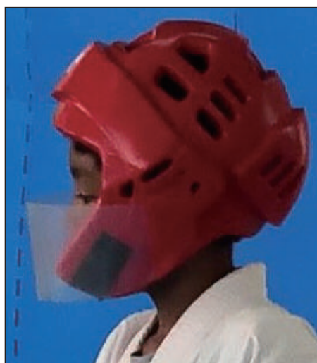
②ロータスクラブ製 KEN スポーツ製