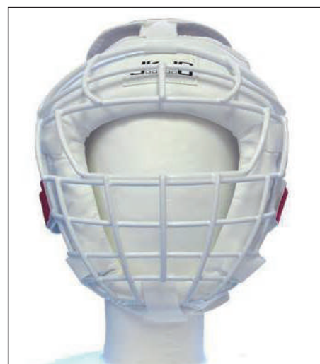
③マーシャルワールド製 イサミ製